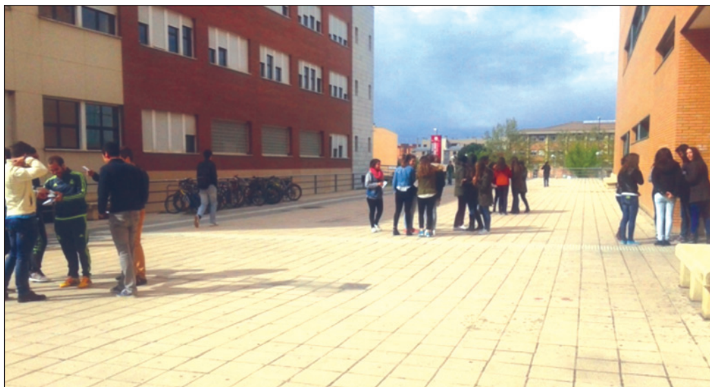
FIGURA 3. El alumnado jugando con la aplicación “Brújula Pro”.