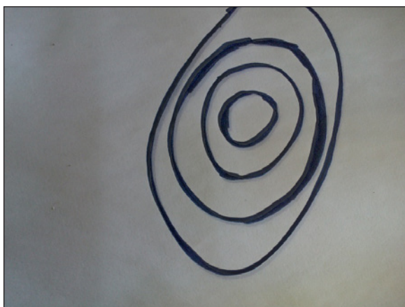
FIGURA 1. Dibujo de curvas de nivel en un folio en blanco.

Una aplicación de realidad aumentada que destaca para la enseñanza es LanscapAR . Es muy sencilla de utilizar y facilita la comprensión de las curvas de nivel. Primero se dibuja en un folio en blanco una representación de una forma de relieve sencilla como una montaña, a través de curvas de nivel concéntricas (ver figura nº 1). A continuación con el dispositivo móvil se captura el dibujo y vemos en la pantalla la visión en Realidad Aumentada de la montaña (ver figura nº 2).