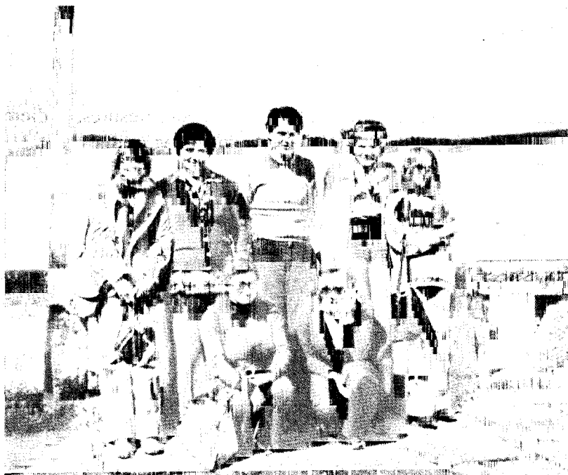
FOTO 1. Grupo de profesores de la Cátedra de Geografía e Historia en una excursión a la costa sur de Galicia.