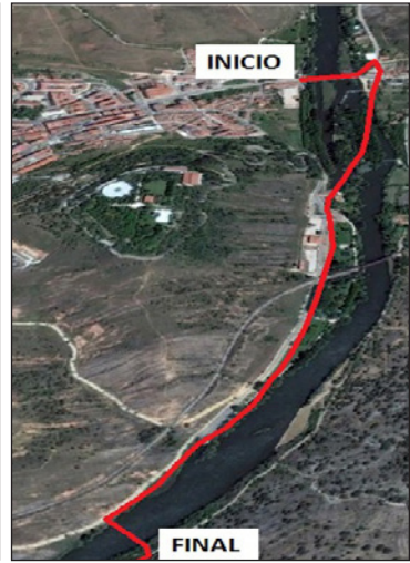
FIGURA 7. Itinerario Ribera del río Duero.