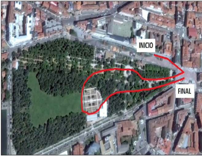
FIGURA 6. Itinerario de la Alameda de Cervantes.