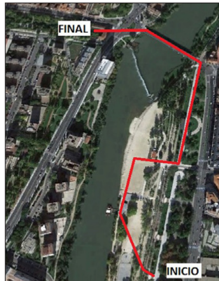
FIGURA 4. Itinerario Ribera del río Pisuerga.