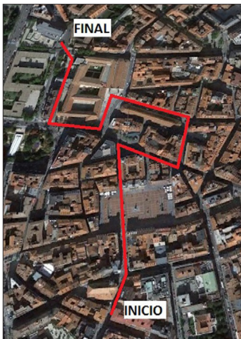
FIGURA 1. Itinerario histórico 1.

En el caso del itinerario histórico 2 (Figura nº2) se ha intentado buscar elementos que desempeñen funciones diversas al itinerario histórico 1. Este recorrido va a continuar por otra parte del centro histórico de la ciudad, y tiene como objetivo completar el conocimiento de los alumnos a través del acercamiento a otras infraestructuras con sus funciones correspondientes. Ejemplo de ello es el Instituto de Educación Secundaria José Zorrilla; el Palacio Real, antigua residencia real y cuartel militar; el Palacio Pimentel, que fue residencia de la nobleza y en la actualidad es sala de exposiciones; la Iglesia de San Pablo, uno de los emblemas artísticos de la capital; el Museo de Escultura, que alberga en su interior una importante colección de obras de arte desde la Baja Edad Media hasta el siglo XIX; el edificio de los juzgados; la antigua universidad; el Teatro Calderón como espacio de ocio, y, finalmente, la catedral como el centro de culto de la ciudad.