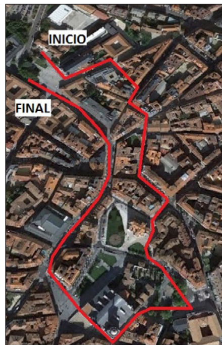
FIGURA 2. Itinerario histórico 2.