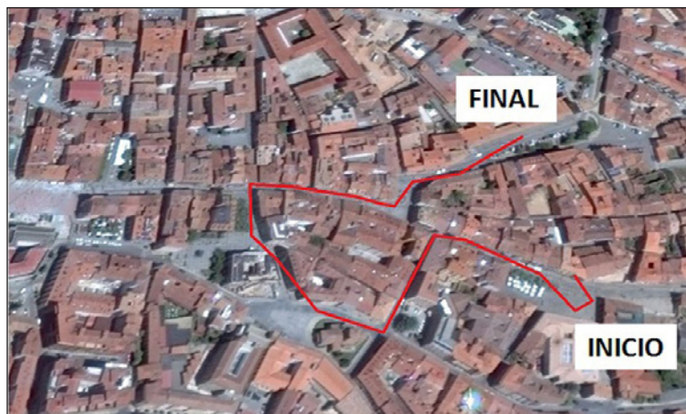
FIGURA 5. Itinerario histórico. Elaboración propia.

El itinerario por la Alameda de Cervantes y sus alrededores (Figura nº6) tiene su comienzo en la oficina de correos principal de la ciudad, una parada en la que podrán trabajar la representatividad de este sistema de comunicación en la sociedad. Justo al lado se encuentra el Museo de Arte Numantino, uno de los símbolos de la ciudad por el papel que tiene la historia de Numancia en la provincia de Soria. Acto seguido se llega a la Plaza de Mariano Granados, un punto de conexión con diferentes barrios de la ciudad, y donde se encuentra la entrada al parque de la Alameda de Cervantes. Este lugar es un jardín histórico, una zona de recreo y de paseo de los sorianos, pero además es utilizado como un espacio didáctico para que los escolares de la ciudad conozcan algunos elementos claves del currículo relacionados con la flora y la fauna. Para ello se apoyan en las numerosas especies vegetales presentes con árboles de hoja caduca y perenne, la presencia de animales como ardillas y aves, fuentes, etc.